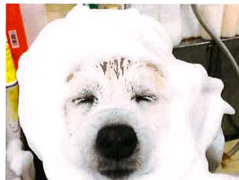
長持ちするようにつ