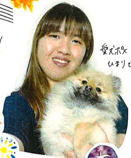
愛犬ボク ひまりですの