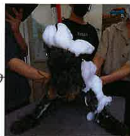
このシゲが水を含んだもの、涙であっはくになります。